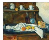
Le buffet, Cézanne, 1877

4 e MOUVEMENT : Le buffet personnifié, allégorie de la mémoire.