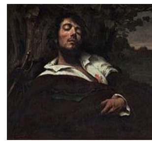
L'homme blessé, COURBET, 1844

RIMBAUD, « Cahiers de Douai », « Le Dormeur du val », 1870